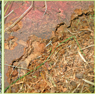
10. Nagespäne; Larvenaktivität in Wurzeln