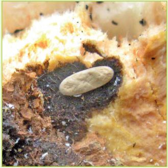
1. Reiskorngroßes Ei, (5 - 6 mm), cremeweiß