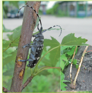
7. Reifungsfraß der Käfer an Ästen