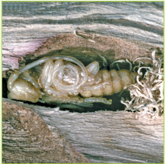
3. Puppe mit grobem Spanpolster