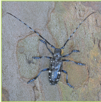
4. Erwachsener A. chinensis form malasiaca , Männchen