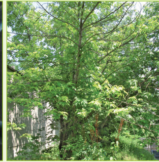
6. Kronenschäden durch CLB-Befall