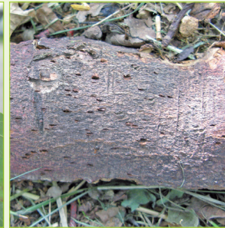
8. Nagespuren für Eiablagestellen