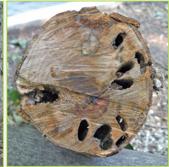
12. Larvengänge im Holzkörper mit beginnender Holzfäule durch sekundären Pilzbefall