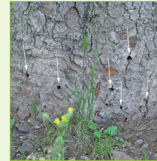
11. Kreisrunde Ausbohrlöcher am Stammfuß