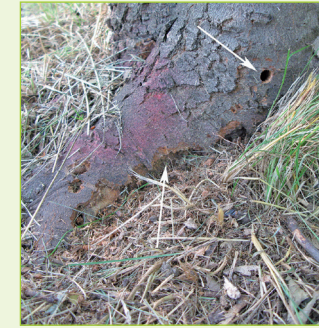
9. Larvenaktivität und Ausbohrloch