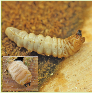
2. Larve mit typischem Halschild