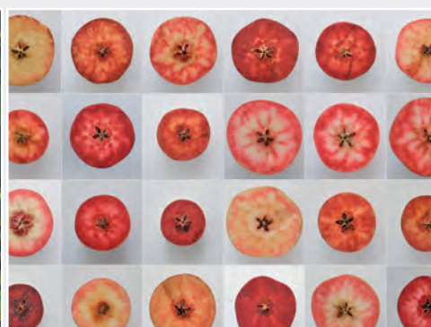
Nachkommenschaft einer Kreuzung mit einer rotfleischigen Apfel-Wildart Progeny after crossing with a red-fleshed wild apple species

The cultivars and accessions of wild species are maintained in ex situ field collections in order to preserve the integrity of the material. At the same time the benefits of these active collections can be described as follows: The perennial plant material can be evaluated comprehensively as well as utilized immediately as primary material for breeding purposes and for plant material exchange. The Malus (apple) collection as well as the Fragaria (strawberry) collection represent the largest ones in Europe.