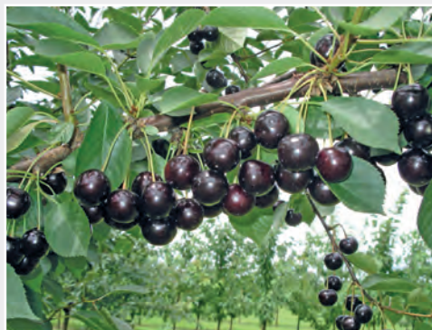
Neue Sauerkirschsorte 'Taurus' New sour cherry cultivar 'Taurus'