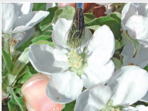
Kreuzungen bei Apfel: Künstliches Bestäuben der Narben mit fremden Pollen Apple crossing: artificial pollination with foreign pollen

Die Charakterisierung der Wirkungsweise von Genen - vor allem von Resistenzgenen aus dem Wildarten-Genpool - und ihrer Beteiligung an der Merkmalsausprägung im Phänotyp werden mit Hilfe gentechnischer Verfahren durchgeführt (funktionelle Genomanalyse). So richten sich die Institutsarbeiten beim Apfel vor allem auf die Verbesserung der Feuerbrandresistenz. Mit der kürzlich entwickelten Fast-breeding-Technologie, der gentechnisch veränderte Apfelpflanzen mit einer stark verkürzten juvenilen Phase zugrunde liegen, ist es möglich, innerhalb von wenigen Jahren mehrere Kreuzungsgenerationen bei Gehölzpflanzen zu absolvieren. Der Fast-Breeding-Ansatz gewinnt seine Bedeutung und Eleganz vor allem aus der Tatsache, dass in den späten Selektionsstufen zielgerichtet Zuchtklone ausgelesen werden können. Diese enthalten die gewünschten Resistenzgene, sind aber nicht transgen, da sich das zuvor eingebaute Gen für „frühe Blüte“ entsprechend den Mendelschen Regeln herauspaltet.