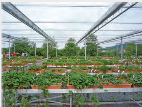
Erhaltung von Erdbeersorten und Fragaria -Wildarten in der Obstgenbank Maintenance of strawberry cultivars and Fragaria wild species in the Fruit Gene Bank

Eine erfolgreiche Obstzüchtung wird in Zukunft vom Einsatz molekularbiologischer und biotechnologischer Züchtungsmethoden abhängig sein. Vor allem die markergestützte Selektion (MAS) hat sich zu einem unverzichtbaren Verfahren entwickelt. Bei der Auswahl der Eltern, die für eine Kreuzung verwendet werden, kommen nicht nur äußere Merkmale (Phänotyp) in Betracht.