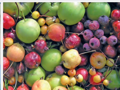
Wildäpfel – die Vorfahren des Kulturapfels Wild apples – ancestors of domesticated apple

tial technology. Not only visible traits (phenotype) of the plants are under investigation when selecting parent generation for crosses. The genetic background (genotype) is analyzed as well in order to select appropriate parents. Based on this, suitable parents are used for hybridization aimed on a targeted combination of traits in the progenies. Later on molecular markers will be applied to select progenies based on their genome in an early stage of the breeding process. This is especially the case when desired traits still are not expressed, i.e. only later during flowering and fruiting of the tree. Due to this very early possibility of selection, breeding programs can be realized more efficiently concerning personal and spatial resources and in a shorter time frame.