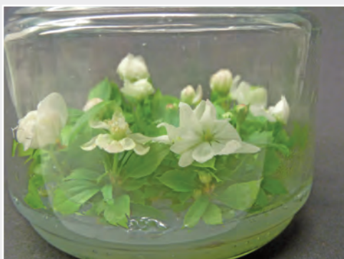
Induktion der Blütenbildung an In-vitro -Pflanzen bei Apfel Induction of flowering on in vitro apple plants

Kommerziell angebaut werden in Deutschland gegenwärtig ca. 30 verschiedene Obstsorten mit nur jeweils wenigen Sorten. Daher sammelt, erhält, charakterisiert und dokumentiert das Institut die noch vorhandene Vielfalt von Obstsorten und -sorten sowie verwandter wild vorkommender botanischer Arten und Gattungen. Besonderes Interesse gilt alten Sorten mit soziokulturellem, lokalem oder historischem Bezug zu Deutschland. Bewertet werden vor allem pomologische und phänologische Merkmale sowie die genetische Diversität. Diese Daten schaffen die Grundlage, das Material u. a. für züchterische, obstbauliche und landschaftsgestaltende Aufgaben zu nutzen. Nur Material, dessen Eigenschaften bekannt sind, kann durch die Züchtung gezielt in Wert gesetzt werden. Darum bündeln sich die Arbeitsinhalte des Instituts zur Erhaltung genetischer Ressourcen, Phytopathologie, Züchtungsforschung und Züchtung in diesem Punkt. Alle erhobenen Daten werden zukünftig in einer gemeinsamen Datenbank für Evaluierungs- und Charakterisierungsdaten erfasst.