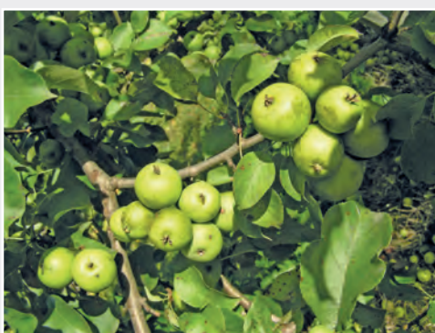
Der heimische Holzapfel Malus sylvestris Indigenous apple species Malus sylvestris