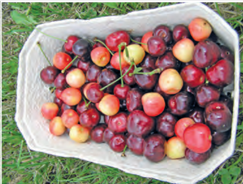
Diversität bei Süßkirsche Diversity of sweet cherry

In der Bundesanstalt für Züchtungsforschung an Kulturpflanzen (BAZ) wurde die Obstzüchtung ab 1992 in Dresden fortgesetzt. Mit der Reorganisation der Forschung des früheren Bundesministeriums für Ernährung, Landwirtschaft und Verbraucherschutz wurde zum 1. Januar 2008 das Julius Kühn-Institut (JKI) gegründet und die Pillnitzer Obstzüchtung als wichtiges Arbeitsgebiet integriert. Eine enge partnerschaftliche Zusammenarbeit verbindet die