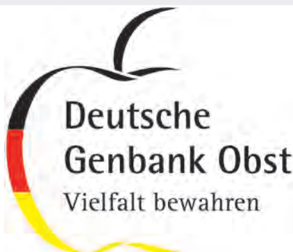
Logo der Deutschen Genbank Obst (DGO) Logo German National Fruit Gene Bank