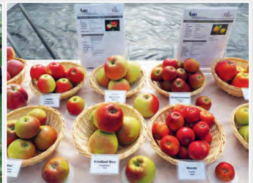
Präsentation der Apfelsortenvielfalt am „Apfeltag“ Presentation of apple diversity