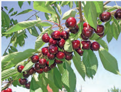
Neue Süßkirschsorte 'PiSue 161' New sweet cherry cultivar 'PiSue 161'