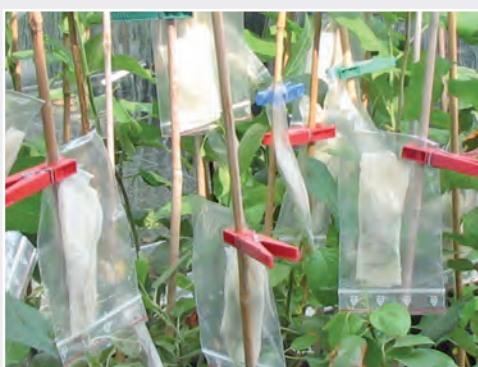
Resistenzprüfung von Apfelsämlingen durch künstliche Inokulation von Schorfpilzen Testing for resistance: inoculation of apple scab on apple seedlings