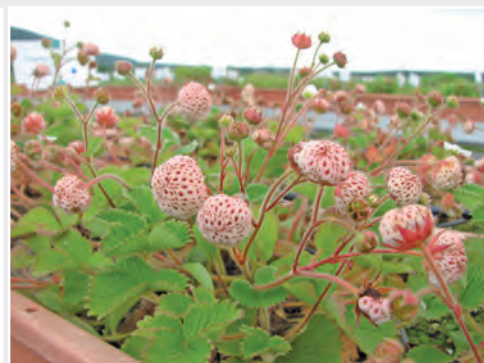
Die Erdbeerwildart Fragaria nilgerrensis Wild strawberry species Fragaria nilgerrensis

are in the responsibility of the Saxon State as well as of the Federation, located at Dresden-Pillnitz. They preserve the tradition of horticulture in the framework "The Green Forum Pillnitz".