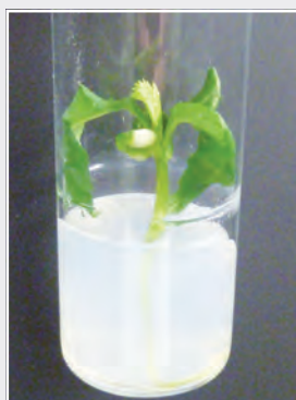
Embryo rescue bei Süßkirsche Embryo rescue in sweet cherry

Im Institut für Züchtungsforschung an Obst wird Zuchtmaterial bis zur neuen Sorte entwickelt. Die Eignung von Sortenkandidaten für den Anbau in Deutschland wird durch den Versuchsanbau der Zuchtklone in den Landesanstalten getestet. Diese wertvolle Zusammenarbeit ermöglicht es, aussichtsreiche Kandidaten auszuwählen, die dann nach einem Prüfverfahren beim Bundessortenamt oder dem europäischen Sortenamt sortenrechtlich geschützt werden. Sie stehen dann dem deutschen Obstbau als neue Sorten zur Verfügung. Sortenschutzinhaber ist das JKI. Die Verwertung der Pillnitzer Obstsorten erfolgt über ein international tätiges Lizenzbüro, die Deutsche Saatgutgesellschaft mbH Berlin ( www.dsg-berlin.de ).