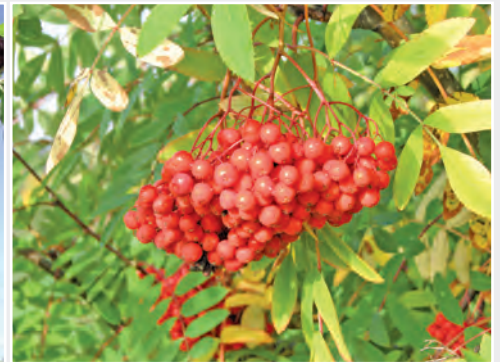
Die Edelebereschensorte 'Konzentra' aus Pillnitzer Züchtung Rowan cultivar 'Konzentra' from the Pillnitz breeding program

The core competence of the Institute for Breeding Research on Fruit Crops in Dresden is focused on