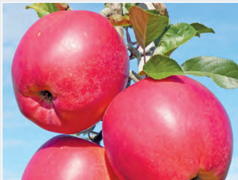
Neue Apfelsorte 'Joachim Gauck' New apple cultivar 'Joachim Gauck'